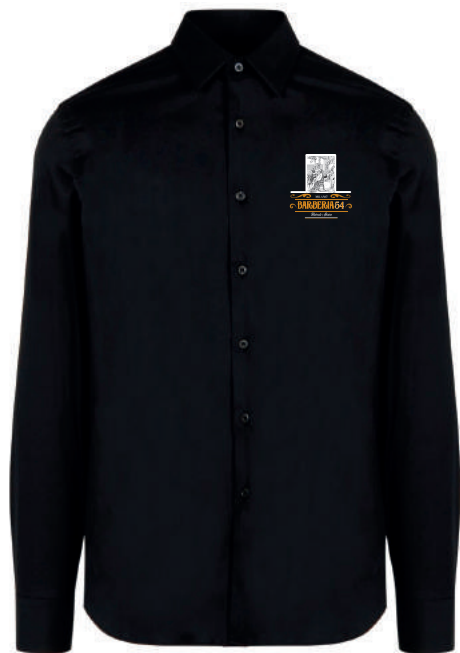
CAMICIA BARBERIA 54 MILANO