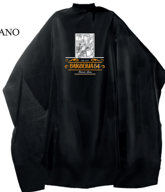
MANTELLA BARBERIA 54 MILANO