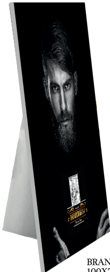
BRAND VISIBILITY IMAGE 100X70 BARBERIA 54 MILANO