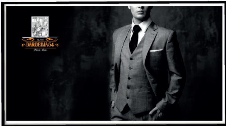
MANIFESTO 50X70 BARBERIA 54 MILANO