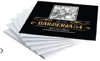
QUADRO 50X50 BARBERIA 54 MILANO