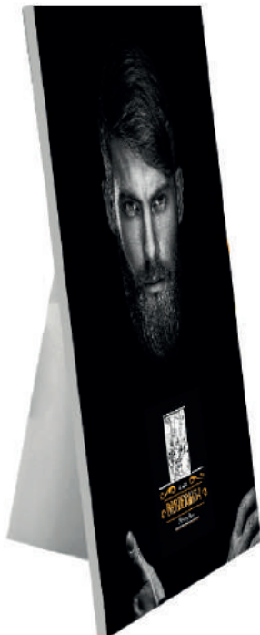
BRAND VISIBILITY IMAGE 100X70 BARBERIA 54 MILANO