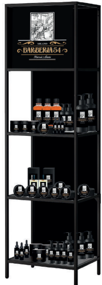
EXPO BARBERIA 54 MILANO