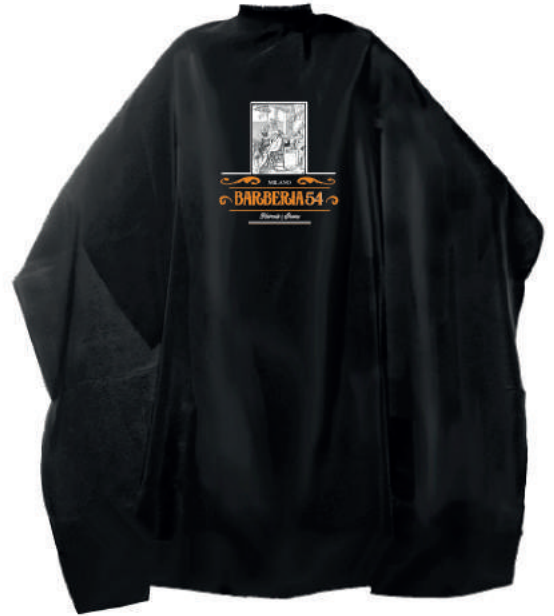
MANTELLA BARBERIA 54 MILANO