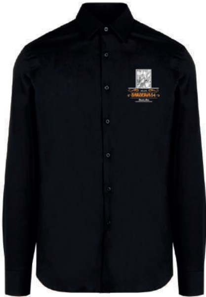
CAMICIA BARBERIA 54 MILANO