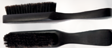
FADE BRUSH BARBERIA 54 MILANO 8,00 €