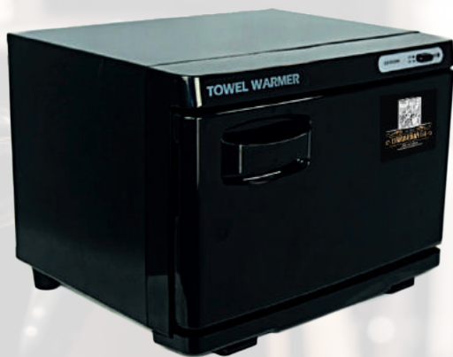
FORNETTO BARBERIA 54 MILANO 214,00 €