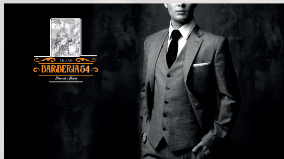
MANIFESTO 50X70 BARBERIA 54 MILANO