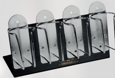
PORTA MACCHINETTE BARBERIA 54 MILANO 38,00 €