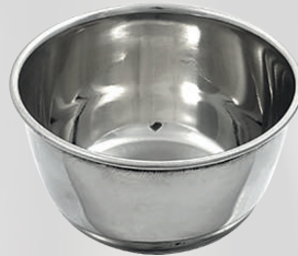
CIOTOLA BARBERIA 54 MILANO 10,00 €