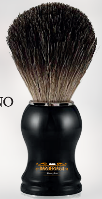
PENNELLO BARBERIA 54 MILANO 10,00 €