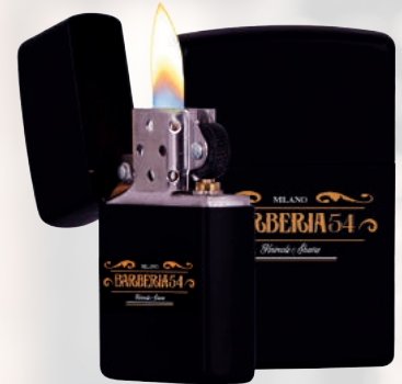
ACCENDISIGARI BARBERIA 54 MILANO