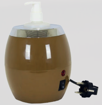
PROFESSIONAL CREAM WARMER BARBERIA 54 MILANO 66,00 €