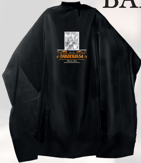
MANTELLA BARBERIA 54 MILANO