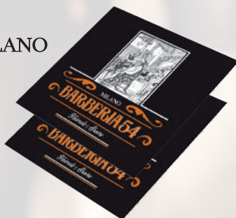
PIEGHEVOLE BARBERIA 54 MILANO 1,50 €