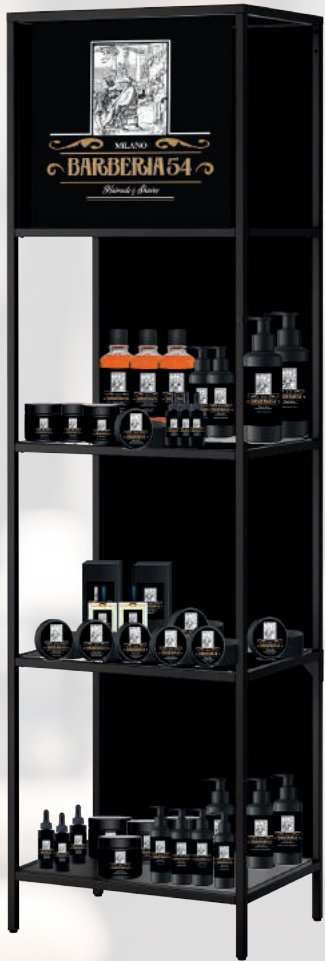
EXPO BARBERIA 54 MILANO 170,00 €